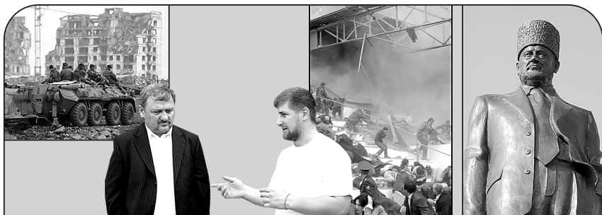
Так выглядел Грозный в 1995 году

И Ахмад Кадыров в 2005 году был убит террористами во время праздничного парада ко Дню Победы на стадионе в Грозном. За что? Он срывал их планы.